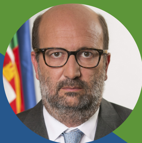
João Pedro Matos Fernandes

Ministro da Ciência, Tecnologia e Ensino Superior