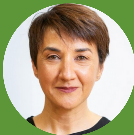
Maria do Céu Antunes

Ministro do Ambiente e da Ação Climática