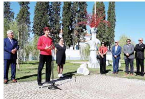
► Inauguração de Escultura de Moisés Preto Paulo

■ O Dia do Concelho arrancou com a cerimónia do Hastear da Bandeira nos Paços do Concelho, a que se seguiu, no Lousal, a Inauguração de Escultura de Moisés Preto Paulo. A obra, que homenageia os 50 Anos do 25 de Abril, simboliza a liberdade, o renascimento e a identidade cultural da aldeia mineira do Lousal.