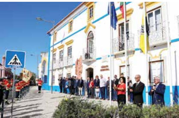
► Cerimónia do hastear da bandeira