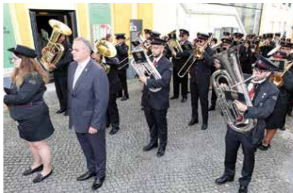
► XXVI encontro de bandas civis de grândola «Celso Tomé Nunes»