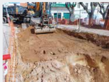
► Figura 3 – ACOMPANHAMENTO ARQUEOLÓGICO EM MELIDES.

tegrados na Carta Arqueológica do Concelho. Tem sido preocupação a valorização de sítios arqueológicos, como a barragem do Pego da Moura, a anta dos Seródios e as ruínas do Cerrado do Castelo (EB1 Grândola), e a sua integração em rotas temáticas, dotando-os de painéis interpretativos (Figura 1), áreas de descanso e condições para a sua fruição pela comunidade. A comemoração de dias temáticos, como o Dia Internacional dos Monumentos e Sítios (18 de abril)