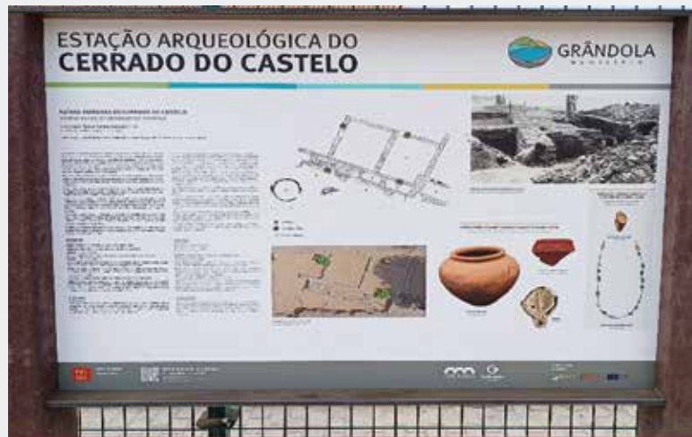
► Figura 1 – PAINEL INFORMATIVO.

Associado a este espaço e aproveitando o edifício da antiga Central Elétrica foram habilitadas áreas para a conservação e restauro de bens museológicos e quatro salas para instalação das reservas museológicas, tendo a de arqueologia sido recentemente credenciada pela tutela (Património Cultural I.P.). Estas condições proporcionaram o desenvolvimento de uma gestão cultural mais abrangente no que respeita ao património arqueológico. Em consequência, nos últimos anos têm sido promovidas várias iniciativas que pretendem ir ao encontro dos princípios definidos na Lei de Bases do Património Cultural (Lei n.º 107/2001, de 8 de setembro) e das funções museológicas consagradas na Lei Quadro dos Museus Portugueses (Lei n.º 47/2004, de 19 de agosto). A inventariação constitui uma ferramenta essencial na gestão e na compreensão das dinâmicas de ocupação do território. Só podemos proteger, valorizar e divulgar se existir um conhecimento exaustivo da realidade. Desde a publicação do primeiro inventário do património arqueológico, anexo ao Plano Diretor Municipal (Aviso n.º 15049/2017), têm sido documentados dezenas de novos sítios, na sequência de trabalhos de prospeção arqueológica, que serão in-