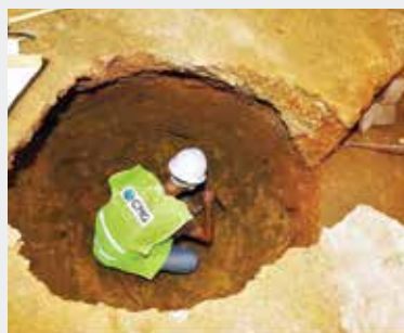
► Figura 4 – ESCAVAÇÕES ARQUEOLÓGICAS NOS ANTIGOS PAÇOS DO CONCELHO.

tegrados na Carta Arqueológica do Concelho. Tem sido preocupação a valorização de sítios arqueológicos, como a barragem do Pego da Moura, a anta dos Seródios e as ruínas do Cerrado do Castelo (EB1 Grândola), e a sua integração em rotas temáticas, dotando-os de painéis interpretativos (Figura 1), áreas de descanso e condições para a sua fruição pela comunidade. A comemoração de dias temáticos, como o Dia Internacional dos Monumentos e Sítios (18 de abril)