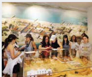
► Figura 5 – VISITA DE ALUNOS DE GRÂNDOLA AO NMSP.

ou o Dia da Arqueologia (24 de julho), ou a participação em iniciativas como as Jornadas Europeias de Arqueologia (junho) ou as Jornadas Europeias do Património (setembro), têm sido o mote para a organização de visitas guiadas que visam a divulgação do património arqueológico concelho (Figura 2).