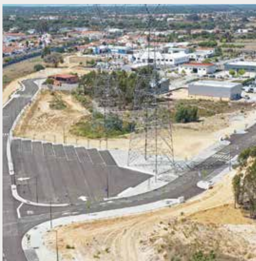
► Desenvolvimento económico