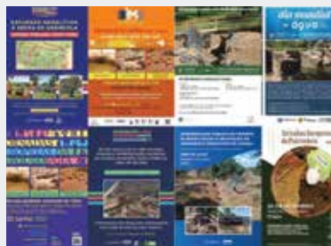
► Figura 2 – CARTAZES DE DIVULGAÇÃO DE INICIATIVAS.