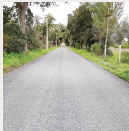
► Requalificação dos caminhos rurais