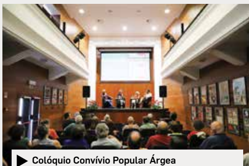
▶ Colóquio Convívio Popular Árgea