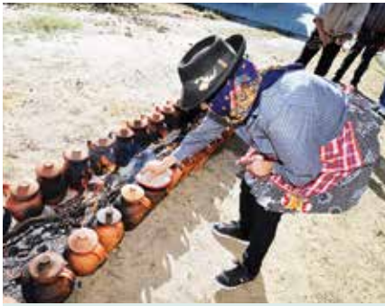
► SABERES E SABORES FESTA DA COQUEIRA