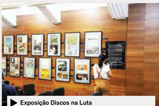
▶ Exposição Discos na Luta