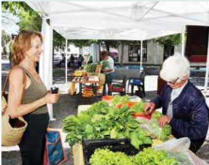
► ECONOMIA A HORTA VAI À VILA