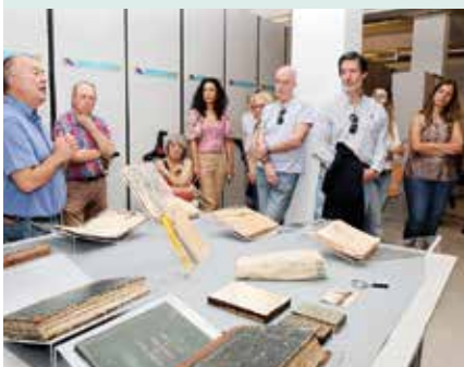
► ARQUIVO DIA DOS ARQUIVOS