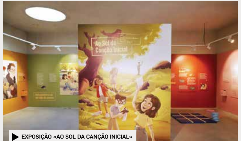
▶ EXPOSIÇÃO «AO SOL DA CANÇÃO INICIAL»