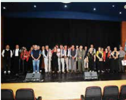
► CULTURA TARDE CULTURAL