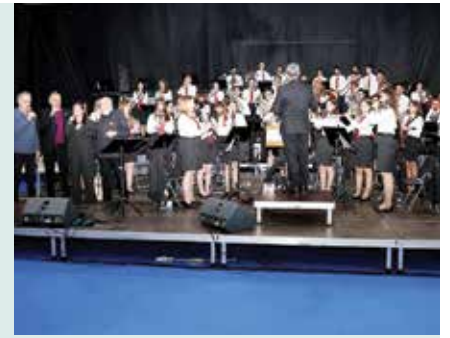
► ASSOCIATIVISMO | ESPETÁCULO DE ANIVERSÁRIO DA S.M.F.O.G