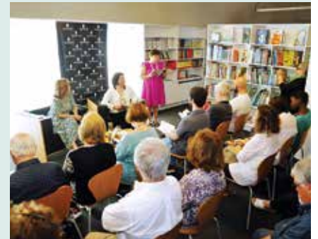
► LITERATURA | APRESENTAÇÃO DO LIVRO «PRECÍPIO»