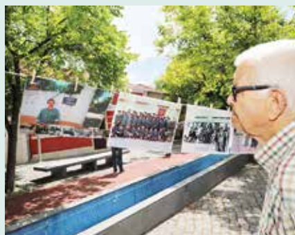
► PATRIMÓNIO | EXPOSIÇÃO O MEU LUGAR DE MEMÓRIA