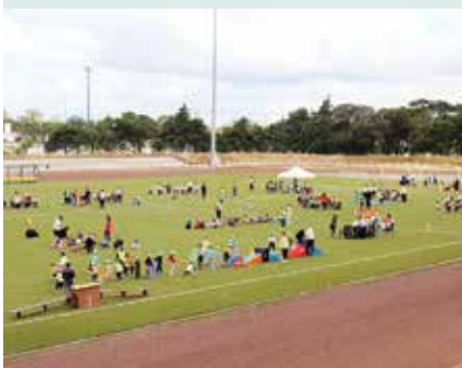
► DESPORTO | 10º CONVÍVIO DESPORTIVO JARDINS DE INFÂNCIA