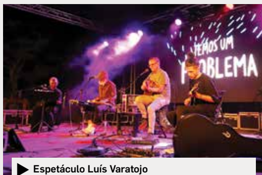
▶ Espetáculo Luís Varatojo