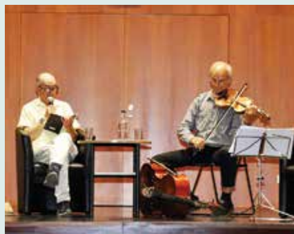
► LITERATURA | APRESENTAÇÃO DO LIVRO «O MAL PELA RAIZ»