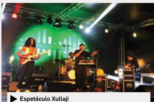
▶ Espetáculo Xullaji