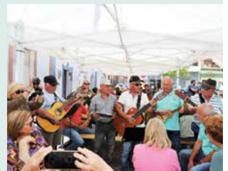
► FESTA HÁ ARRAIAL NA PRAÇA