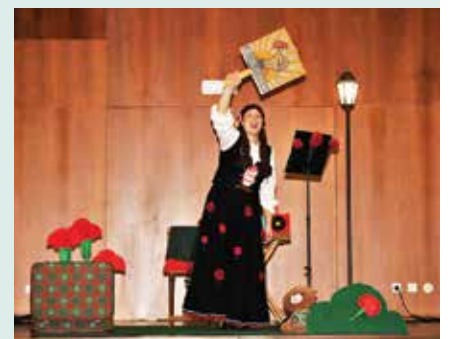
► BIBLIOTECA | É UMA VEZ ... CANTIGAS DE ABRIL DA CAROLINA