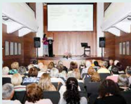
► SOCIAL | AÇÃO COMUNITÁRIA: CONEXÕES – “CULTIVAR O BEM-ESTAR NA COMUNIDADE”