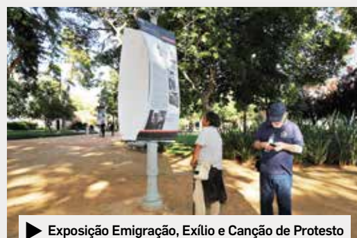
▶ Exposição Emigração, Exílio e Canção de Protesto