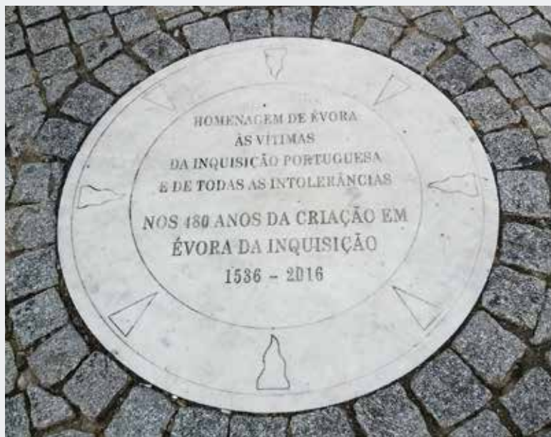
► Memorial evocativo das «vítimas da Inquisição portuguesa e de todas as intolerâncias». Praça do Giraldo, em Évora, no local onde foram queimadas as primeiras vítimas do Tribunal do Santo Ofício. Inaugurado em 22 de outubro de 2016.

Seguiu-se, em 19 do mesmo mês, novo interrogatório ao suposto herege na casa do despacho da Inquisição de Évora: disse chamar-se Jerónimo Genovês e ser natural de Génova; não soube dizer que idade tinha, mas, baseados no seu aspeto físico, os inquisidores consideraram-no de cerca de cinquenta anos; não sabia o nome dos pais por os não ter conhecido; fora criado por um irmão chamado Joachimo, trabalhador e morador em Villamaina (reino de Nápoles); disse que não aprendera letras e que era trabalhador e cavava e amanhava vinhas e fazia os mais serviços em que o ocupavam ; chegara a Lisboa havia cinco anos [1589] e embarcara em Nápoles contra a sua vontade, pois o obrigaram a en-