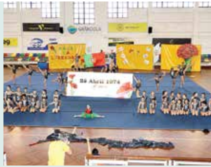
► CULTURA GALA DA LIBERDADE