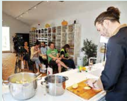
► SABERES E SABORES SHOWCOOKING – ALIMENTE O SEU CORAÇÃO COM PEIXE