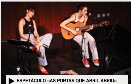
▶ ESPETÁCULO «AS PORTAS QUE ABRIL ABRIU»

Grândola. O título da obra homenageia José Gomes Ferreira e Sophia de Mello Breyner Andresen, baseando-se nos seus poemas «Jornada» e «25 de Abril», respetivamente.