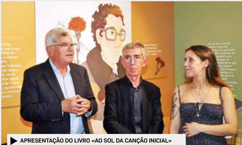
▶ APRESENTAÇÃO DO LIVRO «AO SOL DA CANÇÃO INICIAL»