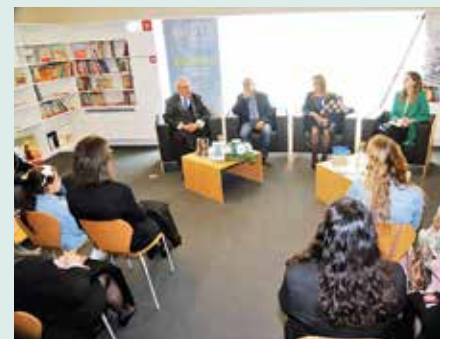
► LITERATURA | APRESENTAÇÃO DO LIVRO «BANDO DE ASAS SOLTAS»