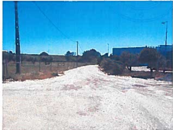
Fotos 2 e 3 – Bairro da Tirana - Rua Evaristo Sousa gago e ligação ao IC1

À semelhança deste troço, temos um outro troço em terra batida que se pretende pavimentar. Este, situado no Bairro da Linha, Ameiras de Baixo. Também aqui bastará a regularização da plataforma com uma camada de 0.10 de espessura em tout-venant e aplicação de betuminoso com 0.05 m de espessura (desgaste). Neste troço há ainda a necessidade de levantar as tampas das caixas de visita (16 unid) da rede esgotos, à cota da rasante.