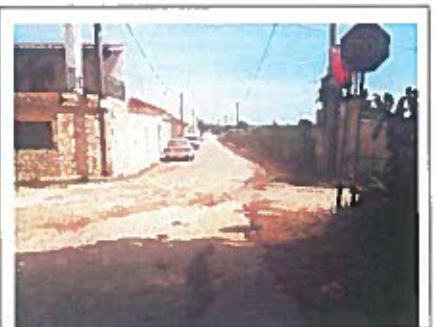
Foto 6, 7 e 8 – Bairro do Isaiás – Rua 22 de Janeiro e Rua 1ª Maio