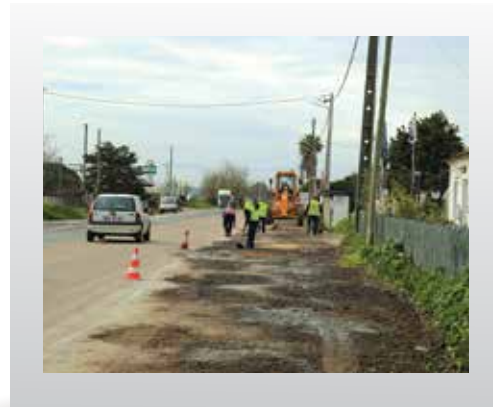
TIRANA – MELHORAMENTOS NOS ACESSOS | CARVALHAL – EXECUÇÃO DE PASSEIOS | ISAÍAS – MELHORAMENTOS NAS BERMAS