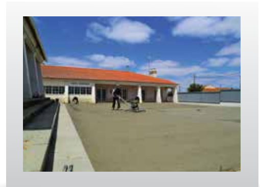
LOUSAL - LIMPEZA COM UTILIZAÇÃO DE VARREDOURA | GRÂNDOLA - PINTURA DE PASSADEIRAS | CADOÇOS - PISO EM BETÃO NO EXTERIOR DO CENTRO COMUNITÁRIO