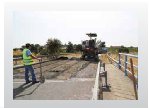
GRÂNDOLA - CORREÇÃO DE DESNÍVEL ATRAVÉS DA REPAVIMENTAÇÃO DO PISO DOS ENCONTROS DA PASSAGEM SUPERIOR SOBRE A AUTO-ESTRADA | LOUSAL - LIMPEZA DE RIBEIRA | ALDEIA DO FUTURO - REABILITAÇÃO DA PASSAGEM SUPERIOR SOBRE O CAMINHO DE FERRO